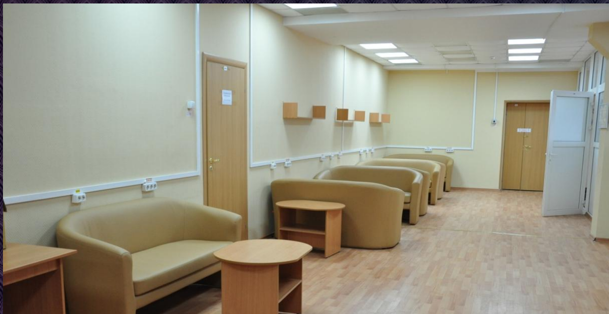
На фото: холл в аудиторной базе АКФ корпуса 35

В соседнем корпусе № 36 факультет имеет дополнительные площади – просторные холлы и аудитории, учебная лаборатория. Все помещения в хорошем состоянии – капитальный ремонт здесь был несколько раньше. Общая площадь всех учебных и вспомогательных помещений базы практики АКФ на предприятии составляет около 2500 квадратных метров.