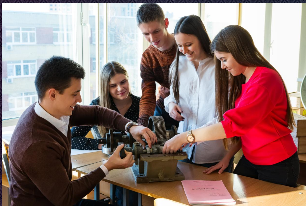
На фото: студенты на занятиях по деталям машин