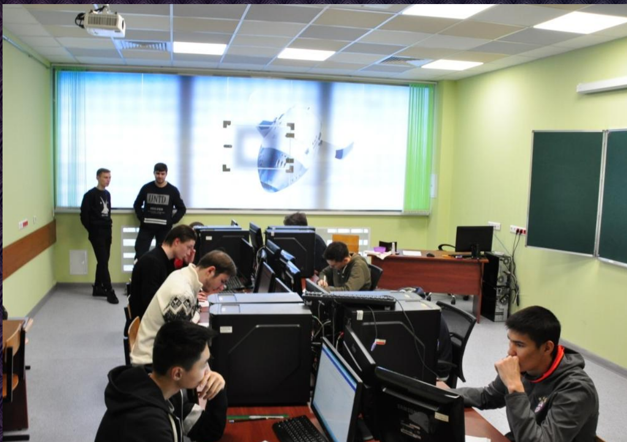
На фото: студенты работают в компьютерном классе

Зайдём в кабинет декана. Стеклойной матовой перегородкой он напоминает комнату для преподавателей. Замечательная, очень красивая кабинетная мебель и витраж.