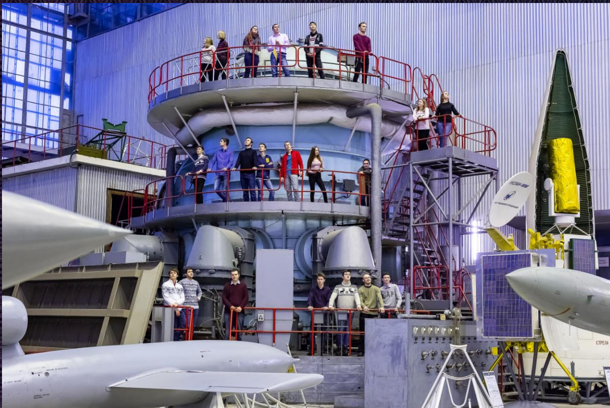
На фото: студенты на стенде вакуумных испытаний